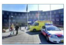
Goede voorbereiding kan veel ellende schelen

20 augustus 2008 - Rampen? De meeste ondernemingen zijn er niet of slecht op voorbereid. Vooral over de communicatie omtrent rampen wordt nog nauwelijks nagedacht. Volgens Frank Hoen van Netpresenter komt dat eenvoudigweg doordat bedrijven vaak niet weten waar te beginnen met het opstellen van een rampenplan.