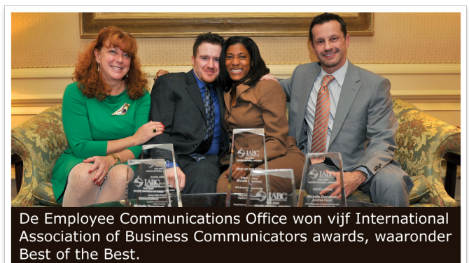
De Employee Communications Office won vijf International Association of Business Communicators awards, waaronder Best of the Best.

Met dit succesvolle project heeft het GPO de prestigieuze ‘Best of the Best’ Silver Inkwell Award van de International Association of Business Communicators (IABC/Washington) gewonnen. De award werd toegekend omdat het GPO haar communicatie in zijn geheel aanzienlijk heeft verbeterd. Hierdoor is de tevredenheid van de werknemers aanzienlijk gestegen en worden alle medewerkers (zowel diegene →